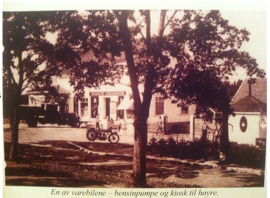
En av varebilene – bensinpumpe og kiosk til høyre.